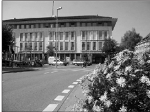
Die Praxis befindet sich im Geschäftshaus Vindonissa, 3. Stock